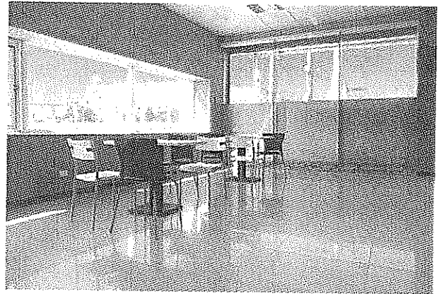
整齊清潔的休息專區