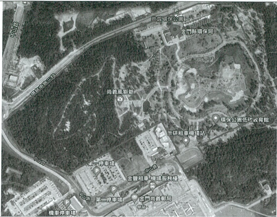
金門縣尚義環保公園 (含所屬停車場) 空氣品質維護區管制區域範圍圖